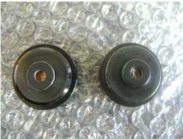
Lens 3 (links) & Lens 4 (rechts)