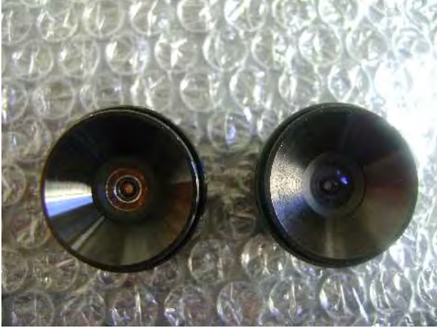
Lens 3 (links) & Lens 4 (rechts)