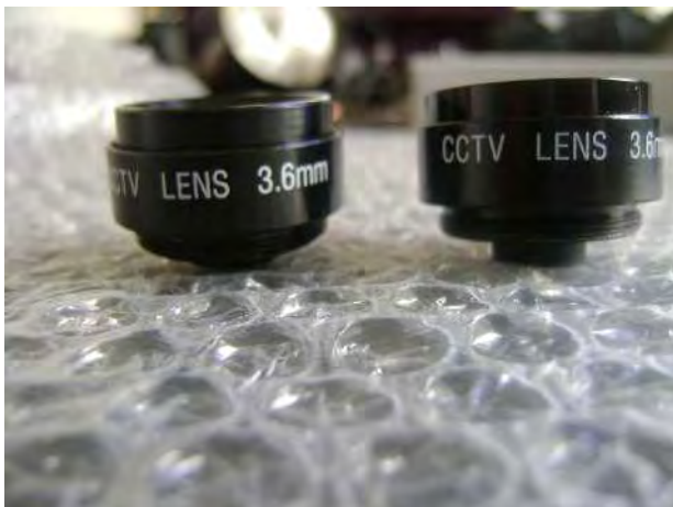
Lens 3 (links) & Lens 4 (rechts)